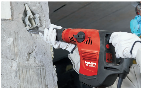
細部のコンクリートハツリ作業に